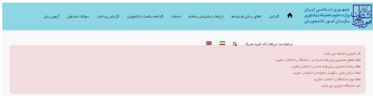
تصویر ۶-نمایش اخطار در صورت وارد نکردن فیلدهای اجباری

در صورت خالی بودن فیلدهای اجباری و یا وجود مغایرت با پیغامی در بالای صفحه در هر مرحله مواجه می شوید که در این حالت سیستم از ثبت درخواست جلوگیری می کند. (تصویر ۶)